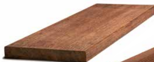
4 faces lisses